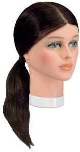
Junior Natura braun