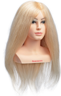
Competition - Plus (long)