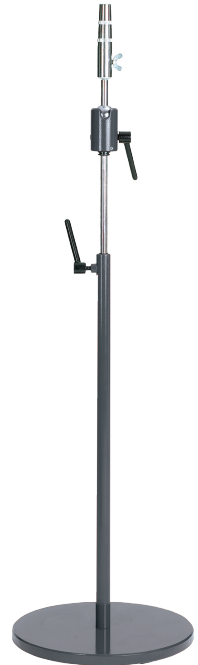
Bodenständer (54/64 cm)