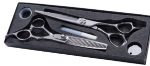
Scheren-Set Haarschneide- und Effilierschere (6.0" + 6.5")